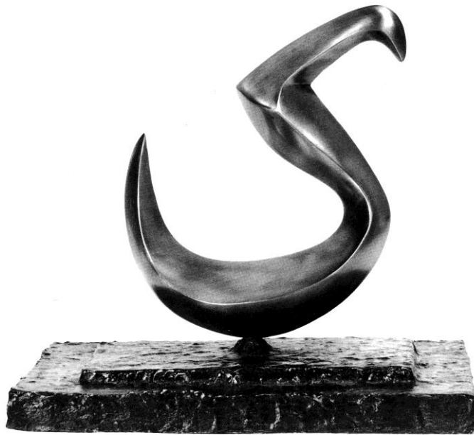
"Yā" – bronze ed. 10 – 18x15 cm